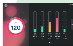
清新 - 暗色