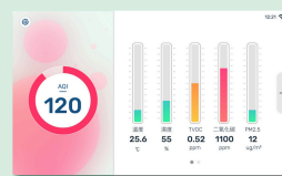
清新 - 亮色