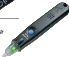
3481: LED 燈